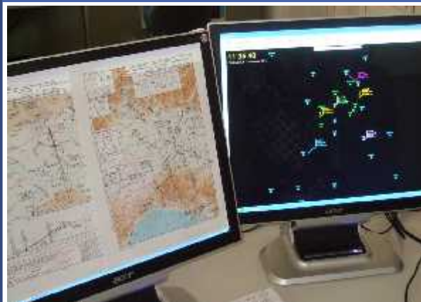
Controllo del traffico aereo